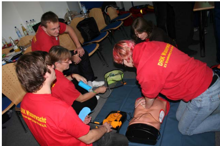
Foto 2: Auffrischung der Wiederbelebung mit der Zwei-Helfer-Methode unter Verwendung eines Defibrillators