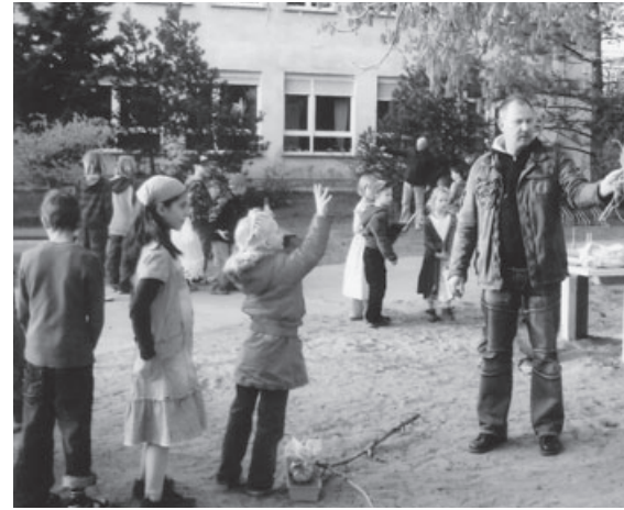
Burgfräulein beim Ballzielwurf.