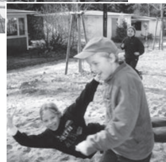
Beim Weitsprung gab es viel zu lachen.