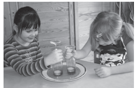
Konzentriertes Beobachten des Kerzenfahrstuhles

Unsere DRK-Kindertagesstätte Haus 6 entwickelt sich zu einem „Haus der kleinen Forscher“, in dem jedes Kind seine Neigungen, Interessen und Begabungen an Naturwissenschaften und Technik entdecken kann.