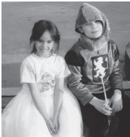
Erschöpft von den vielen Spielen.

Tagesangebote gemacht. Auch die Geburtstage werden in den Gruppen gefeiert.