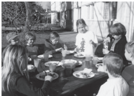
Grillen bei herrlichem Sonnenschein