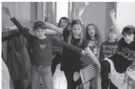
Immer zu einem Spaß aufgelegt.