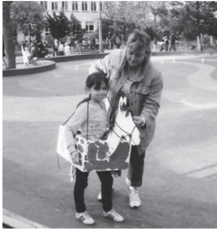
Burgfräulein beim Reiten in den Kinderdorfwald.

Ab ca. 14.00 Uhr werden täglich unterschiedliche Freizeitaktivitäten und Projekte angeboten (z.B. Fußball, Schwimmen, Judo, Schach, künstlerisches Gestalten, Musik, Experimente, Kochen und Backen usw.). Die Kinder entscheiden selbst, woran sie teilnehmen. Unabhängig von den genannten Aktivitäten werden in den Gruppen