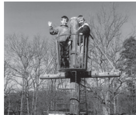
Toben und spielen auf dem großen Freizeitgelände.