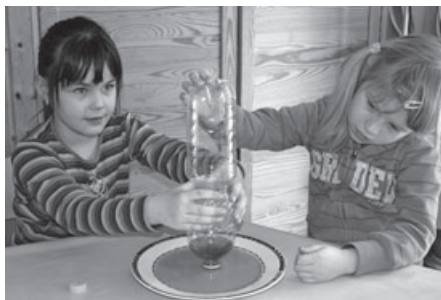
Erstaunlich, die Flaschenpumpe funktioniert.